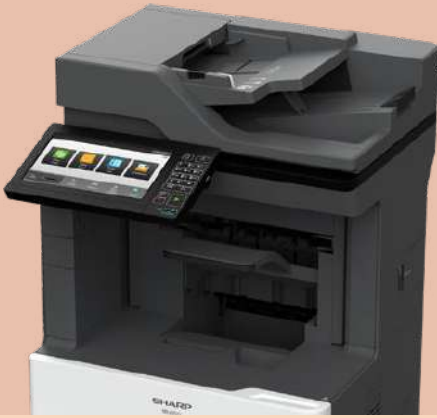
MX-B557F mostrado con acabado opcional.